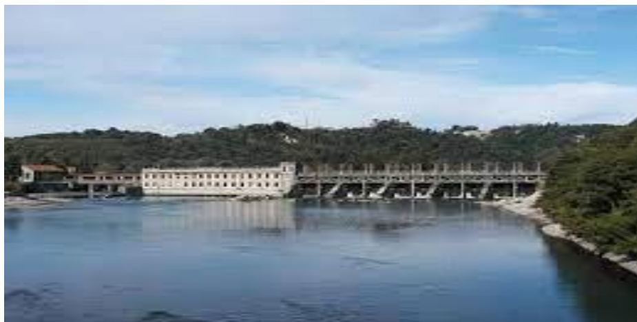
Vecchia configurazione della traversa